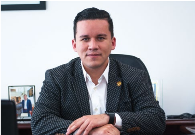
Dip. Hever Quezada Flores Presidente de la Comisión de Ecología y Medio Ambiente LXV Legislatura del Congreso del Estado

El pasado 15 de enero del año en curso el Poder Legislativo Estatal expidió la nueva Ley de Equilibrio y Protección al Ambiente del Estado de Chihuahua, a efecto de garantizar el derecho de toda persona a un medio ambiente sano y saludable.